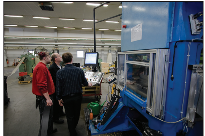
Nu står Famecos 125 tons fyrpelarpress åter på plats i Skillingaryd efter renoveringen på SMV Industrier i Smålandsstenar.