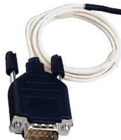
Temperaturgivare -350C till +1400C med 1m kabel art.nr. 18521