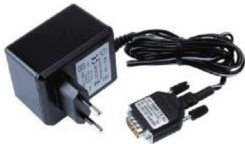
Spänningsgivare 230 V AC art.nr. 18552

Mätresultat presenteras tydligt för effektiv utvärdering.