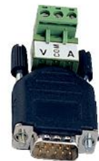
Adapter med Plint, för 0-20mA/0-10 V DC art.nr. 18540